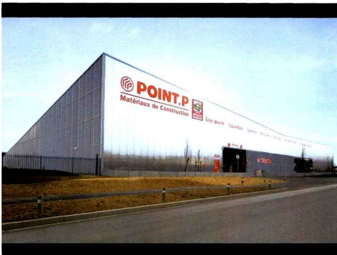
Point.P Massy

Pour la construction d'une nouvelle agence commerciale dans une ZAC francilienne en développement, Point.P a choisi un bâtiment innovant et contemporain qui, de surcroît, s'inscrit dans une démarche éco-responsable de l'enseigne. C'est l'agence BVAU qui a imaginé l'édifice. Découverte.