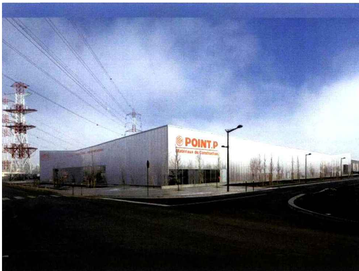
Point.P Massy