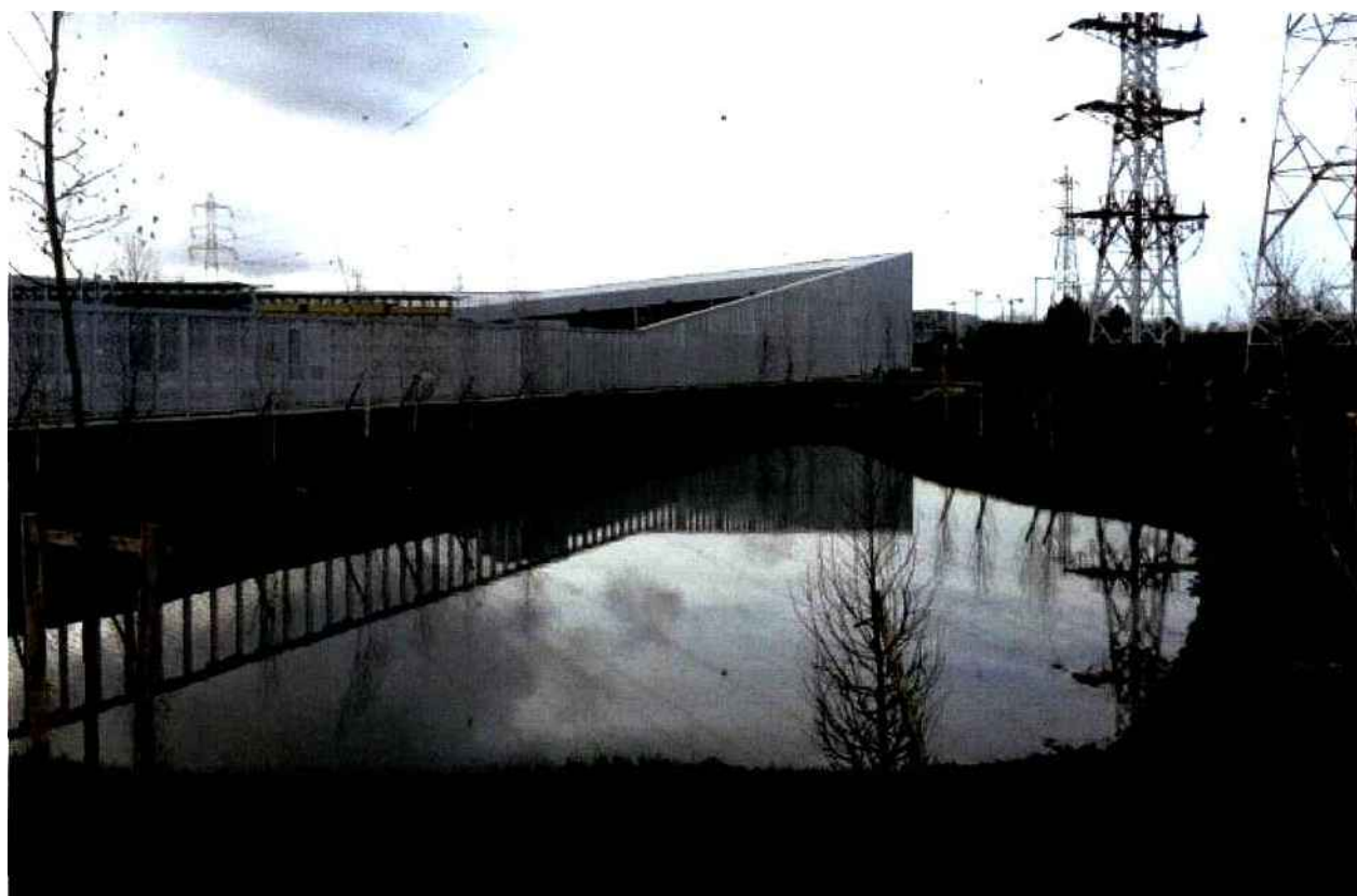
Point.P Massy

Architecturalement, le cabinet BVAU détaille : "Le volume bâti général est translucide et lumineux, il laisse deviner les activités qui s'y trouvent sans les révéler totalement. De jour, c'est une masse opaline horizontale aux pentes précises et douces. De nuit, une architecture de lumière qui éclaire le paysage, faisant signal, une sorte de vaisseau urbain éclairant, accueillant, en partie caché dans un sous-bois" . Les maîtres d'œuvre expliquent avoir travaillé avec le paysage, notamment pour la gestion des eaux de pluies et la transformation des eaux sales.