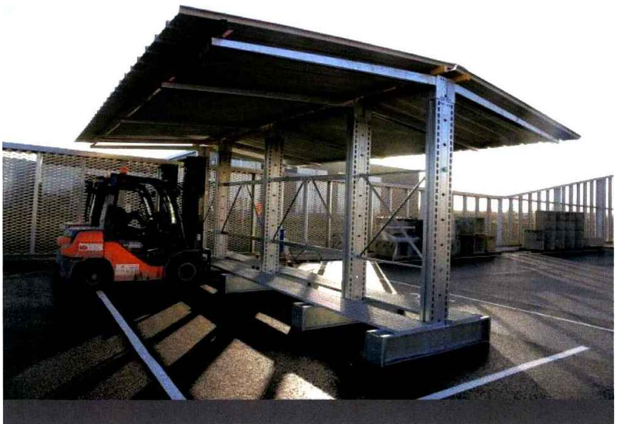
Point.P Massy